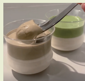
『ほうじ茶プリン』 『抹茶プリン』 ほうじ茶は地元、抹茶は京都のものを使用した、濃厚で香り高いプリンです。