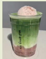
桜×抹茶の、春の限定ドリンク『さくら抹茶ラテ』。塩漬けた桜の葉と桜ソースを加えた桜餅風味のアイスクリームと、優しい甘さの餡、抹茶ラテが絶妙のハーモニーを奏でます。

←『おしるこ』 白砂糖不使用で無添加の、こだわりの餡をたっぷり使用。杵つき焼き餅と小豆、あられが入っています。 汁は抹茶、ほうじ茶が選べます。